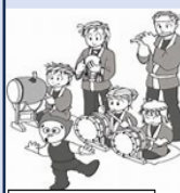
こま武蔵台囃子連