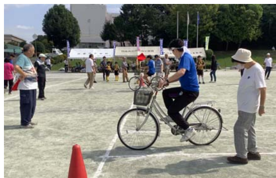
大人の部はなかなか勝負がつかず