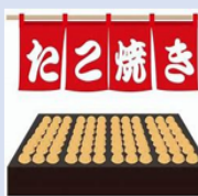
名物：たこ焼き販売