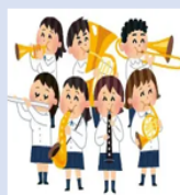
小中学校ブラスバンド演奏