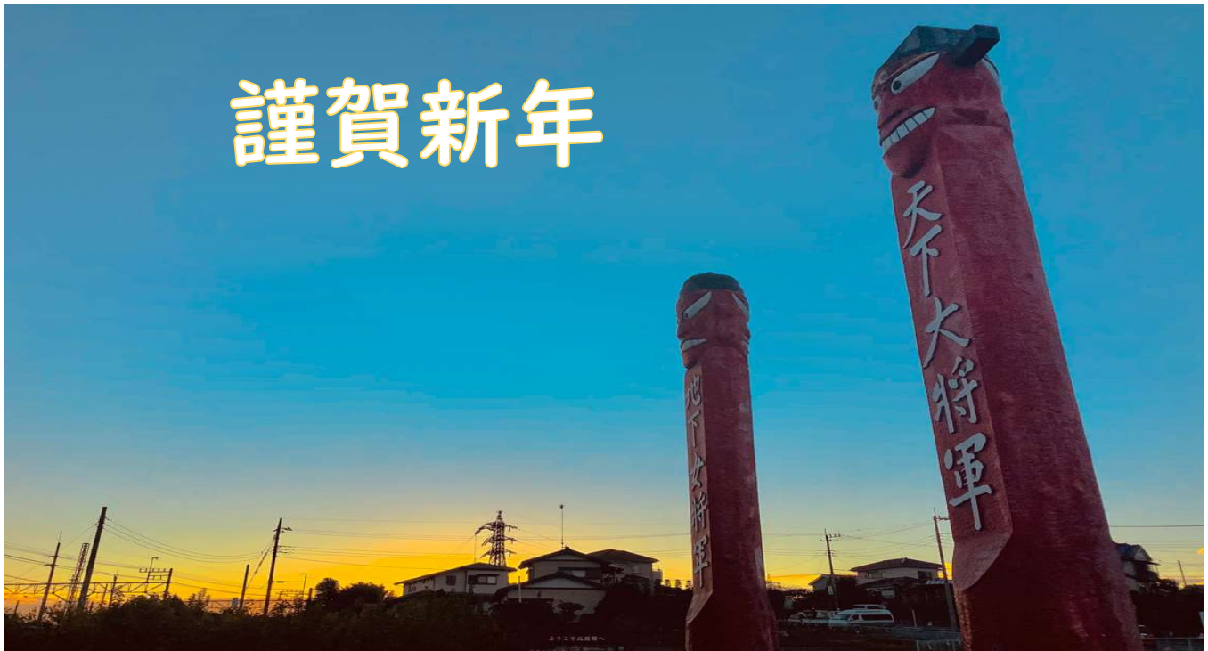
夜明けの高麗駅 将軍標