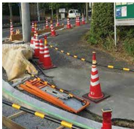
工事が始まりました