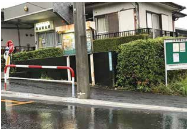
傾斜が少なくなりました

6月にこま武蔵台駐在所前から郵便局にかけての道路の傾斜がきつく、高齢の方が転倒されたこと、自治会に連絡がありました。現場を確認、市へ相談に行きました。7月中ごろから工事が始まり、7月28日には道路の傾斜は緩やかになり、歩きやすくなりました。武蔵台は坂の多い街、その中でも駐在所の歩道は傾斜がきつい場所でした。数年前までは転倒などの話を聞くことはありませんでしたが、高齢化という