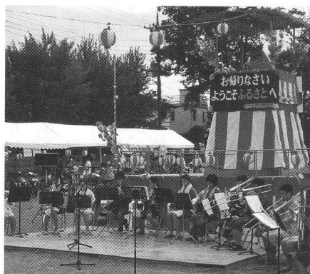
台中の皆さんの素敵なプラスバンド演奏です。