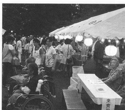
おじいちゃん、おばあちゃんが嬉しそうだね!